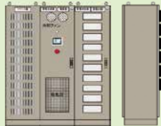
ENECOS-P30 / 67kWh